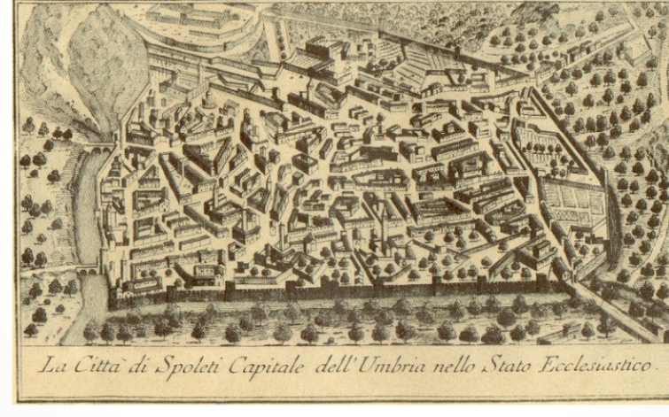
La Città di Spoleto Capitale dell'Umbria nelle Sue Evoluzioni

Variante geomorfologica al Piano Regolatore Generale ai sensi dell'art. 32 commi 3 e 4 della Legge Regionale n° 1 del 21 gennaio 2015 a seguito della sentenza della Corte Costituzionale, 27 luglio 2023